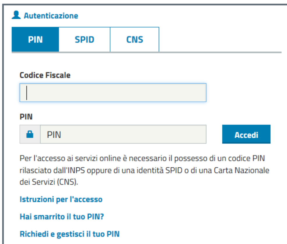
Figura 2: Richiesta credenziali di accesso